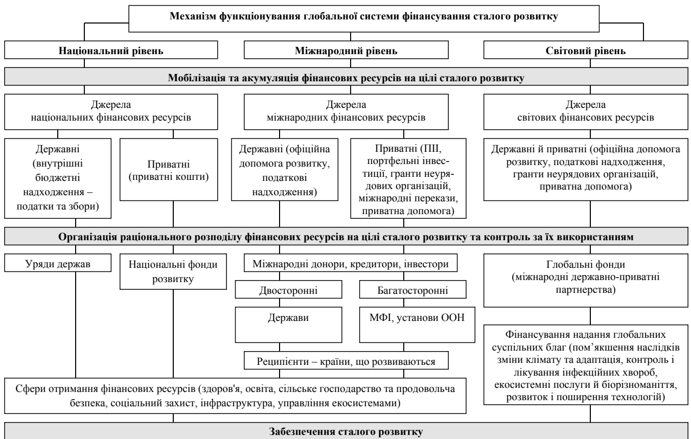
Рис. 1. Механізм функціонування глобальної системи фінансування сталого розвитку*

Визначено, що механізм функціонування глобальної системи фінансування сталого розвитку охоплює процеси мобілізації, розподілу ресурсів та їх використання (рис. 1).