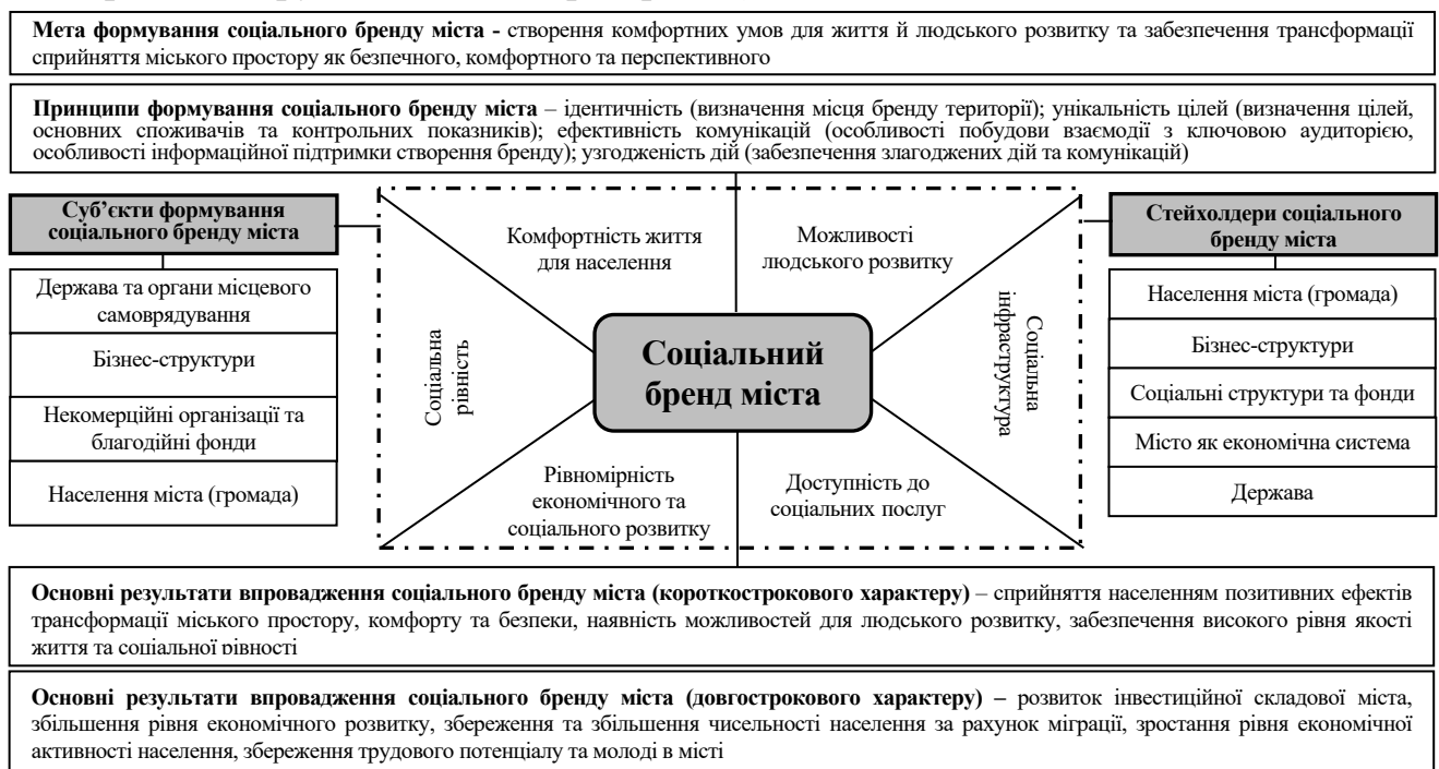
Рис. 1. Модель формування соціального бренду міста

Розкрито сутність категорії «соціальний бренд міста», який визначається як створення комфортних умов для життя й людського розвитку та забезпечення трансформації сприйняття міського простору як безпечного, комфортного та перспективного. Побудовано модель формування соціального бренду міста, яка включає мету, принципи, структурні складові, основні суб'єкти його формування та виокремлено групи стейкхолдерів (рис. 1).